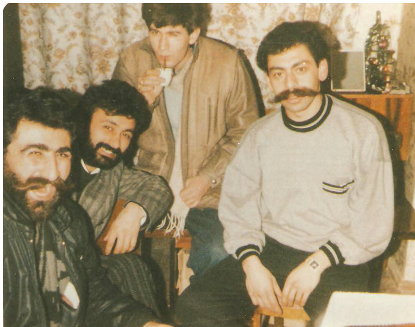
Թաթուլը հանրակացարանի իր սենյակում՝ ընկերների հետ