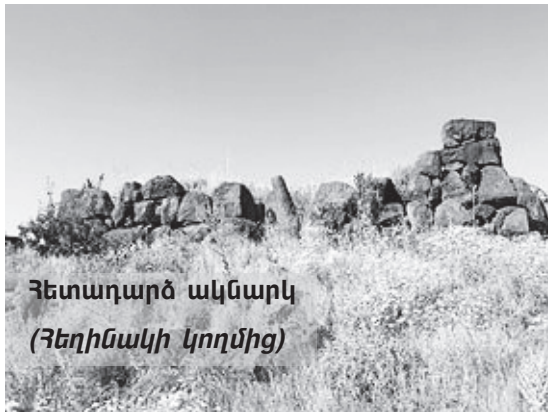
Յետադարձ ակնարկ (Յեղիմակի կողմից)