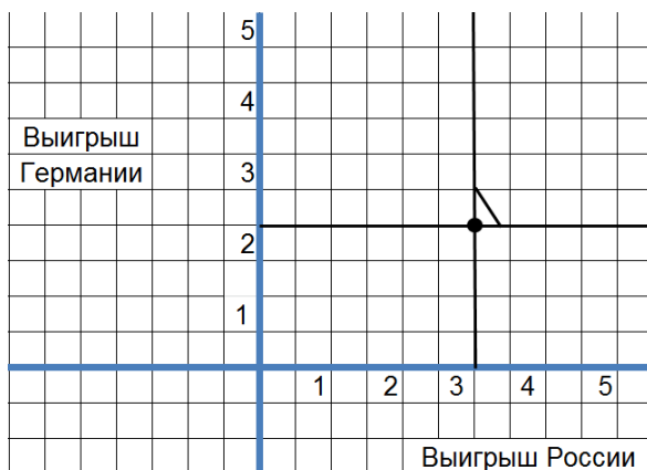
Множество равновесий Нэша