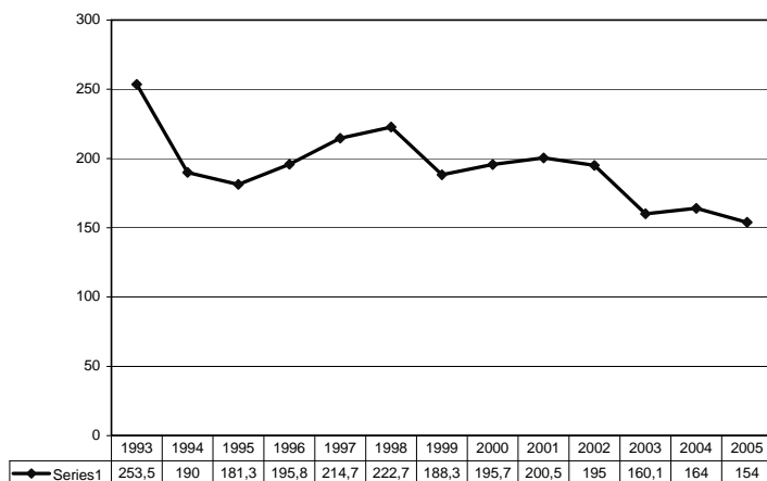
Динамика преступности в Армении, без учета преступления, предусмотренного ст. 75 УК РА и краж личного имущества по коэффициентам на 100 000 населения (рис. 2)

Как видно из приведенного графика, уровень преступности с 1995 до 1999гг. возрастает. Между тем, графическое изображение динамики преступности с учетом преступления предусмотренного ст. 75 УК РА и краж личного имущества (рис. 1) свидетельствует о снижении уровня преступности с 1996 по 1999гг. Кроме того, из приведенного графика видно, что уровень преступности в 2004г. по сравнению с 2003г. вырос, между тем графическое изображение динамики преступности с учетом ст. 75 и краж личного имущества (рис. 1) свидетельствует о снижении уровня преступности в 2004г.